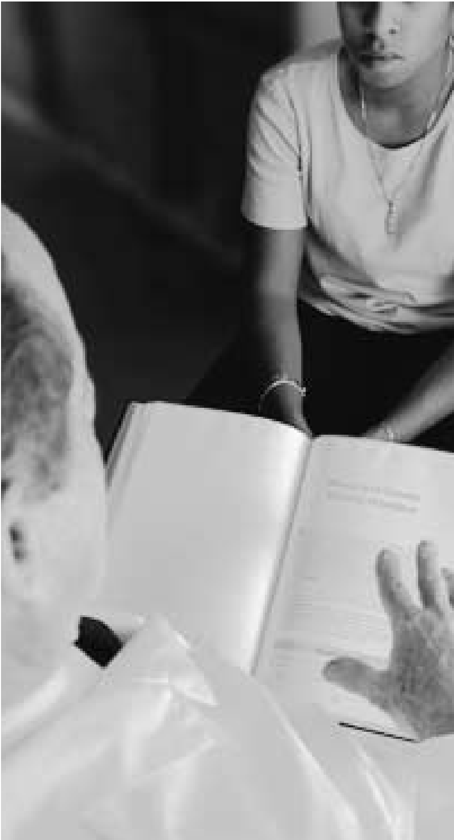
המדריך הדיאגנוסטי והסטטיסטי להפרעות נפש (DSM-IV) של התאחדות הפסיכיאטרים האמריקנית (APA) מסיר את הפליליות של מעשה פלילי ומגדיר אותו כסטייה שנובעת מנתונים ביולוגיים.